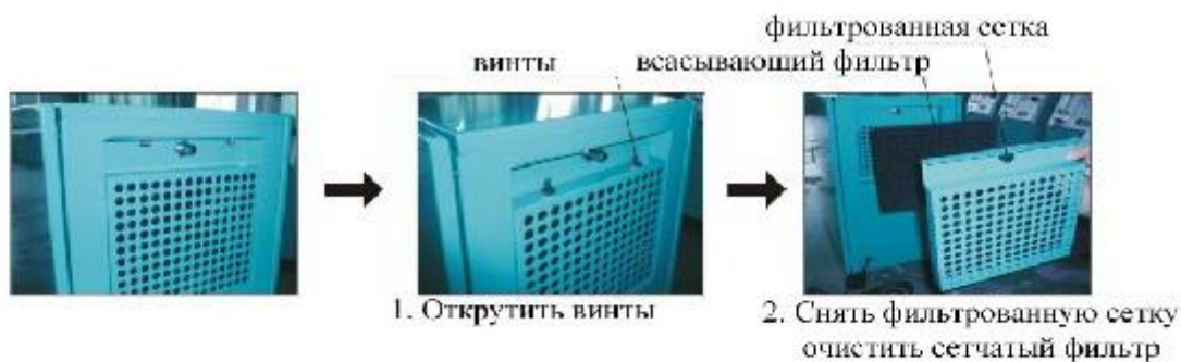
Очистка сетчатого фильтра

Рекомендуется очищать сетку всасывающего фильтра каждые две недели, но не реже каждые 100 часов работы.