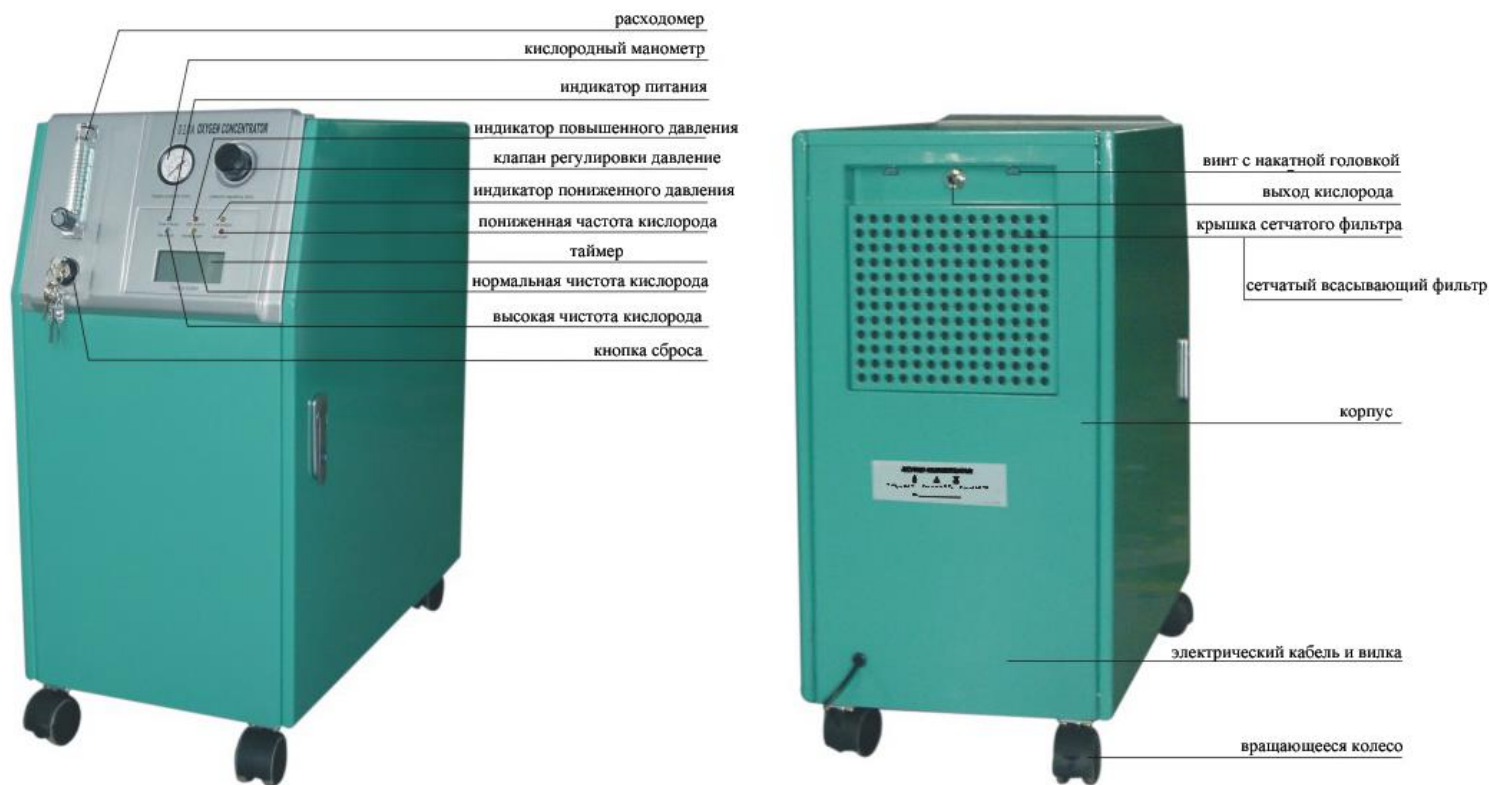
Рис. 2 Схема работы LF-H-10A