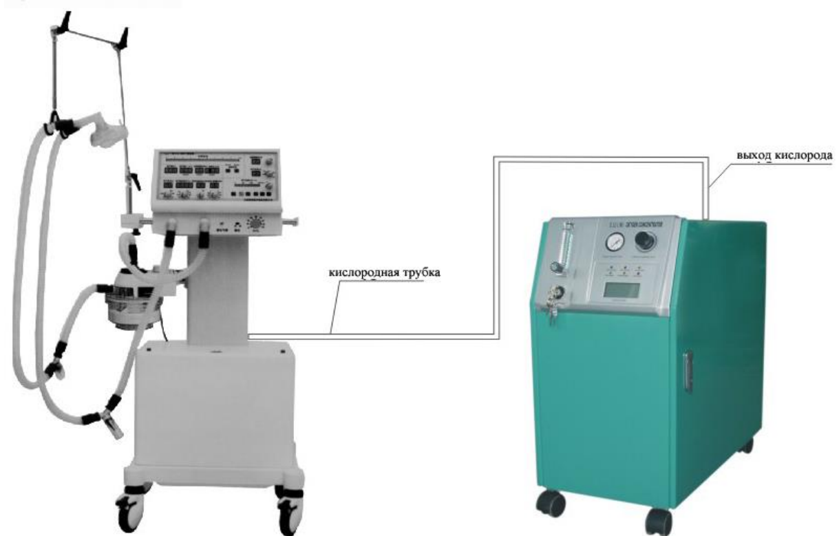
Рис. 5. Схема подключения кислородного концентратора к дыхательному аппарату

В) Установите редуктор давления на кислородный терминал