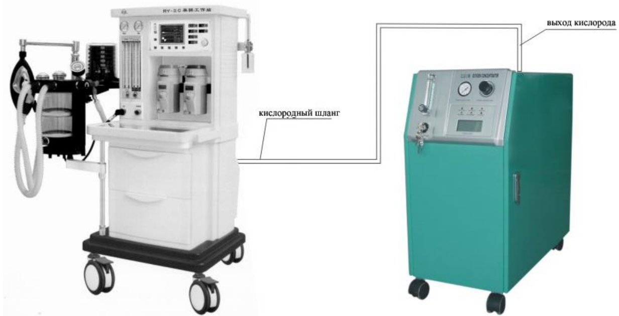
Рис. 4. Схема подключения кислородного концентратора к наркозному аппарату или аппарату искусственной вентиляции легких